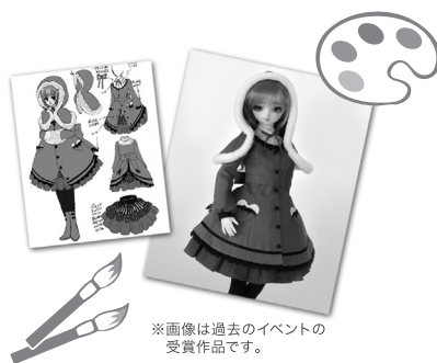
※画像は過去のイベントの受賞作品です。

ドレスデザイン選手権のテーマは『光』と『闇』! どちらか1つ、もしくは両方を選んでOKです。